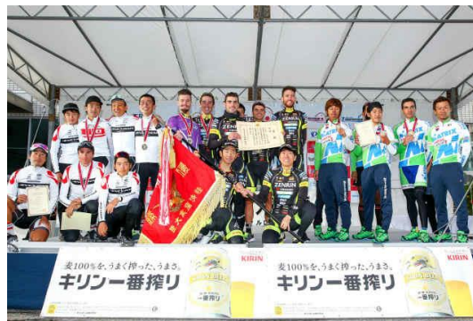
栄えある経済産業大臣旗は2年連続で Team UKYO の元へ